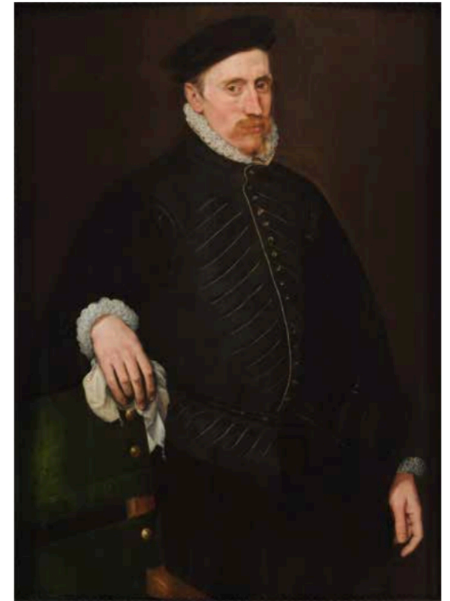
Anthonis Mor van Dashorst, Halfslag portret van een man , ca. 1550, olie op paneel, 99 x 71,8 cm. © Nicholas Hall, New York.

Samen met het portret van Granvelle openbaart het werk de fundamentele transformatie in portretkunst die plaatsvond in Antwerpen rond 1550. De sculpturale uitwerking door vroeg-Nederlandse meesters moest plaats maken voor een meer schilderkunstige, realistische weergave. De geleidelijke overgangen in kleur en het levendige spel tussen licht en schaduw krijgen meer belang; de contouren worden zachter en de kleurtinten van de huid natuurlijker. De vluchtige, witte impasti op het oor illustreren het toenemende vertrouwen in lossere, expressievere penseelstreken. De invloed van de Venetiaanse schilderkunst, en dan vooral Titiaans colorito dat kleur, textuur en schilderkunstige bravoure met elkaar verenigt, stimuleert deze evolutie. Ook de steeds uitgebreidere medische kennis en interesse in fysionomie oefenden een sterke invloed uit. Meer dan een louter esthetische keuze waren de kleur, textuur en uitstraling van de huid indicatoren van de gezondheid en het karakter van de geportretteerde. Dat droeg alleen maar bij tot zijn faam: met opdrachten van de Habsburgers of edelen uit Spanje, Portugal, Engeland en Nederland wist Mor van Dashorst tot aan zijn dood een indrukwekkende carrière uit te bouwen.