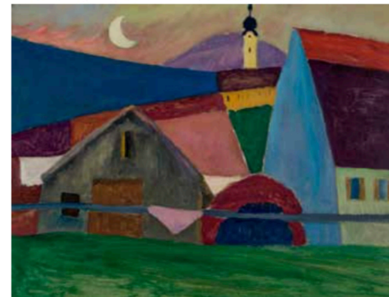
Gabriele Münter, Maan boven Murnau , ca. 1910, olie op karton, 53,1 x 70,1 cm, € 850.000. Galerie von Vertes, Zürich/Freienbach.