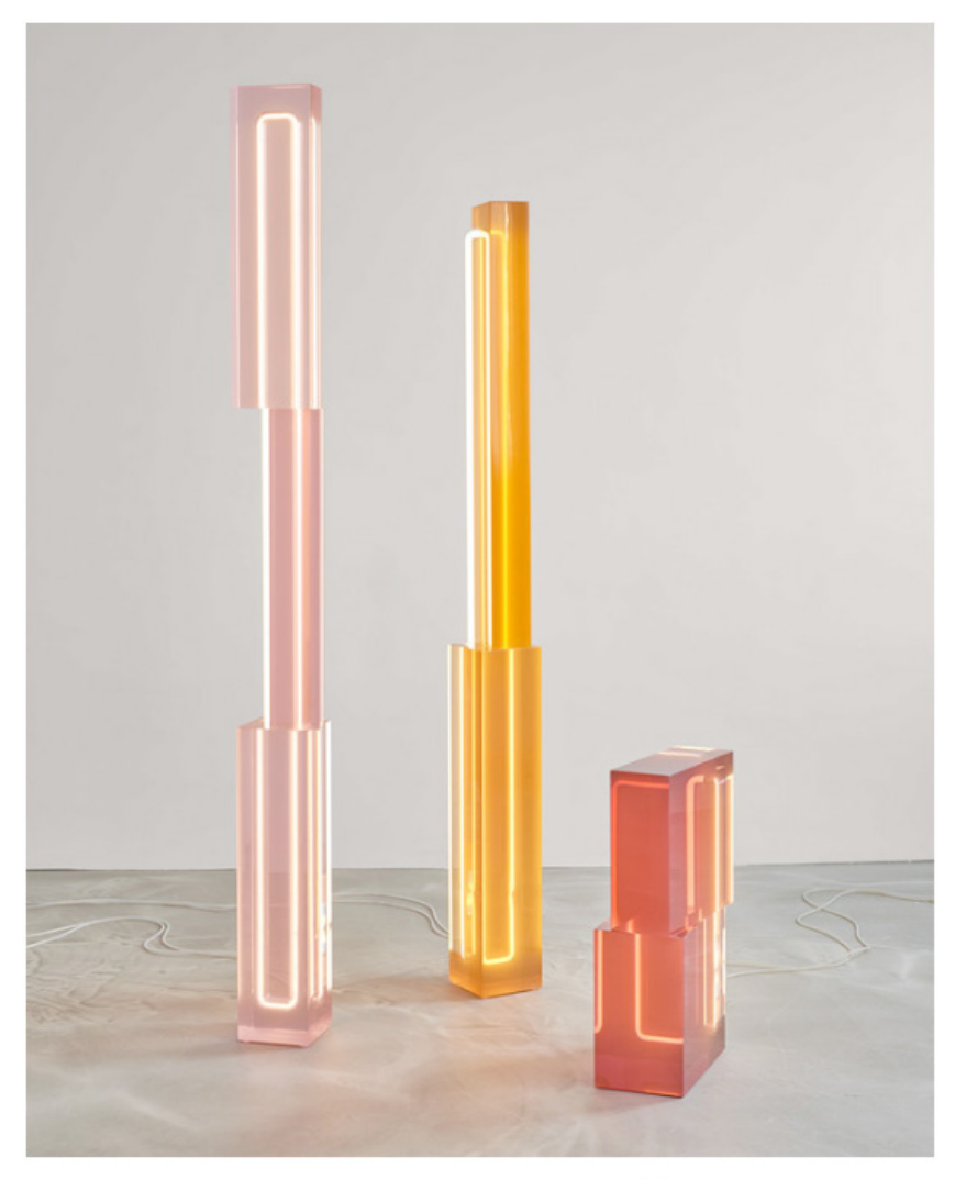
'TOTEM' DE SABINE MARCELIS PARA SIDE GALLERY.

<u>Diseño</u> y <u>arte contemporáneo</u> y del <u>siglo</u> XX junto a piezas de vidrio, cerámicas, arte tribal, antigüedades y joyas: todo eso es lo que vamos a encontrar en la 13ª edición de <u>PAD Londres</u>, una feria que, año tras año, se ha convertido en un punto de encuentro para coleccionistas, <u>galerías</u>, <u>diseñadores</u> y aficionados. Este año en Berkeley Square, donde se ubicará la feria, se reunirán un total de 68 galerías internacionales que representan a un total de 14 países y que, del 30 de septiembre al 6 de octubre, nos ofrecerán un viaje por el arte y el diseño pasando por diferentes épocas y disciplinas.