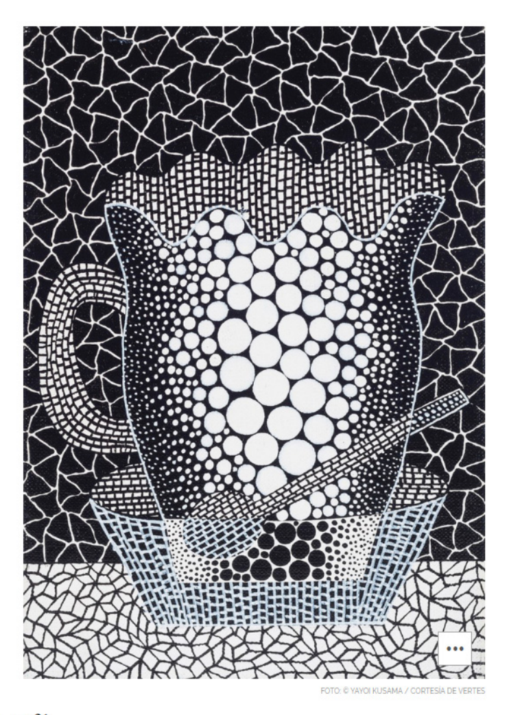
Taza de café

18 de 20 Pieza de Satyendra Pakhalé titulada Kubu , con la Galería Amman.