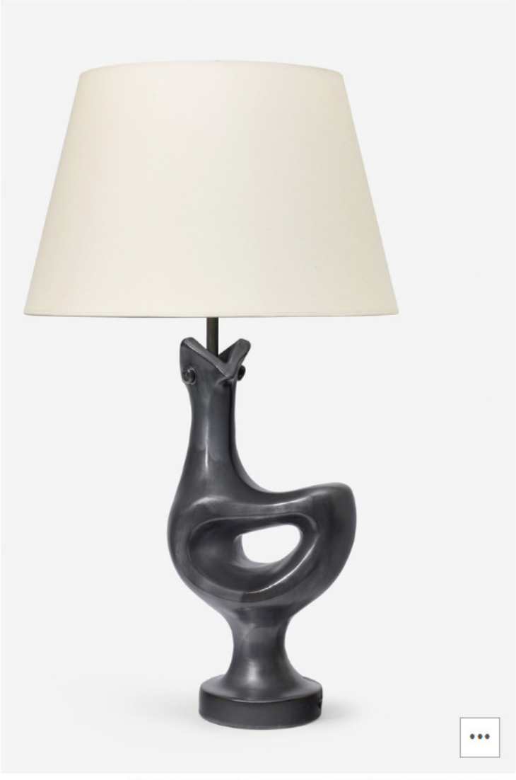
FOTO: © HERVÉ LEWANDOSKI / GEORGES JOUVE / CORTESÍA DE THOMAS FRITSCH - ARTRIUM