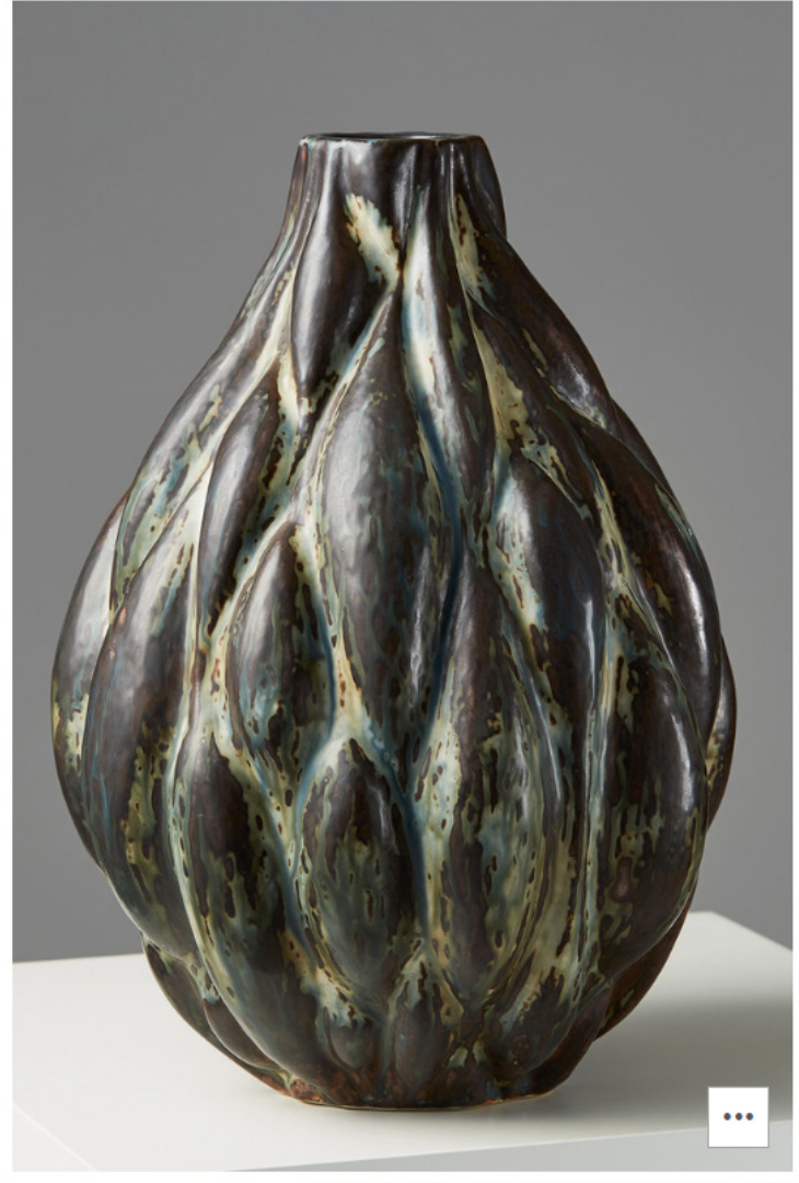
FOTO: © ÁSA LIFFNER / AXEL SALTO / CORTESÍA DE MODERNITY STOCKHOLM